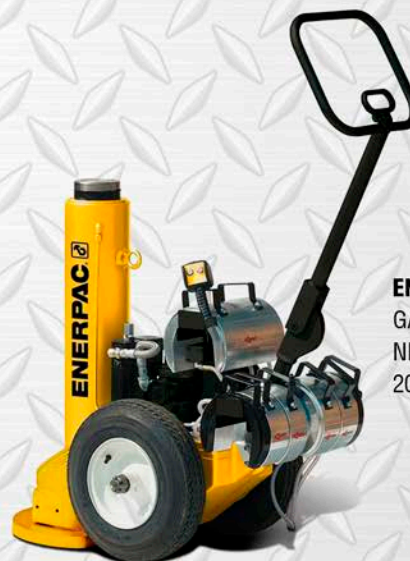
ENERPAC GATA NEUMOHIDRÁULICA 200 TON