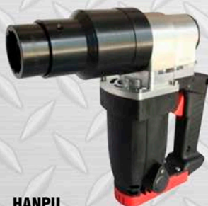
HANPU LLAVE CORTA ESPIGA 1" 3/4" 5/8" 1 1/8" 1 1/2"