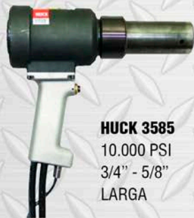
HUCK 3585 10.000 PSI 3/4" - 5/8" LARGA