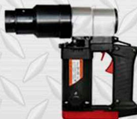
AST SW - 22 3/4"