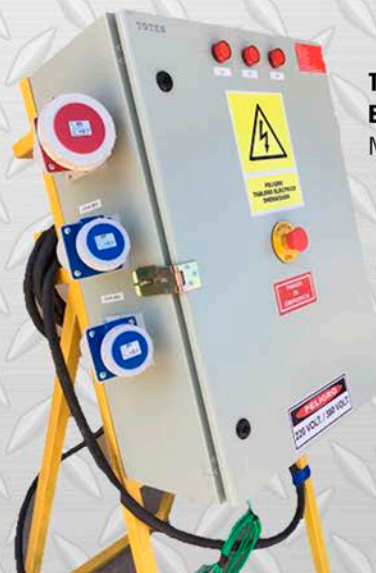
TABLERO ELÉCTRICO MÓVIL NORMA RIC 02