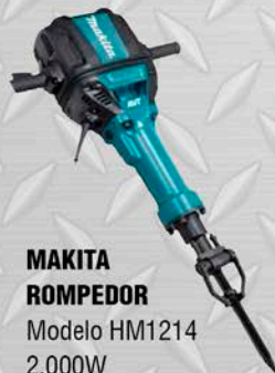
MAKITA ROMPEDOR Modelo HM1214 2.000W