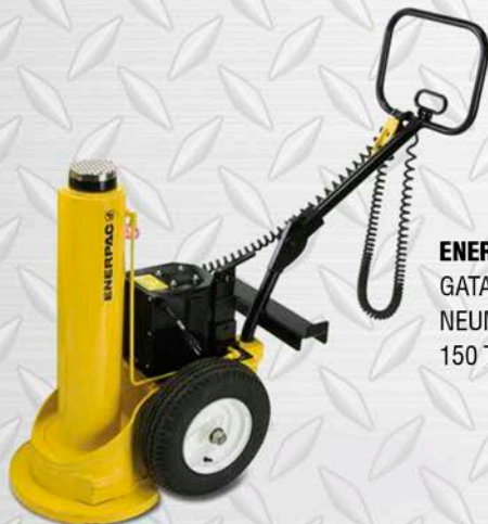
ENERPAC GATA NEUMOHIDRÁULICA 150 TON