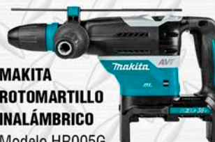
MAKITA ROTOMARTILLO INALÁMBRICO Modelo HR005G SDS - MAX BROCA 40mm. 40V