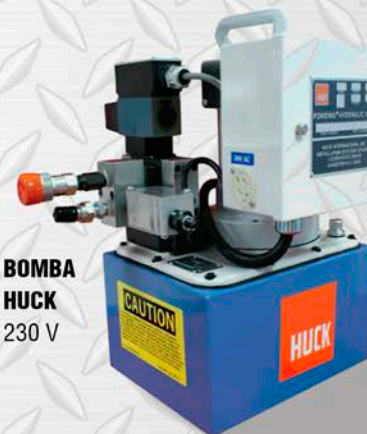
BOMBA HUCK 230 V