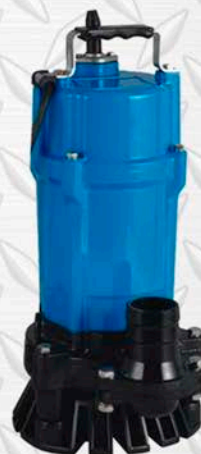
BOMBAS SUMERGIBLES TSURUMI 2-3