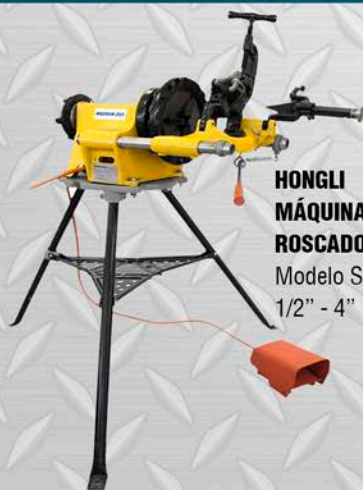
HONGLI MÁQUINA NIPLERA ROSCADORA Modelo SQ100F 1/2" - 4"