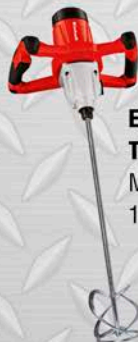
EINHELL TALADRO REVOLVEDOR Modelo TC-MX 1.400W