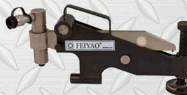
BVA ALINEADOR DE BRIDAS FY - FA9FE