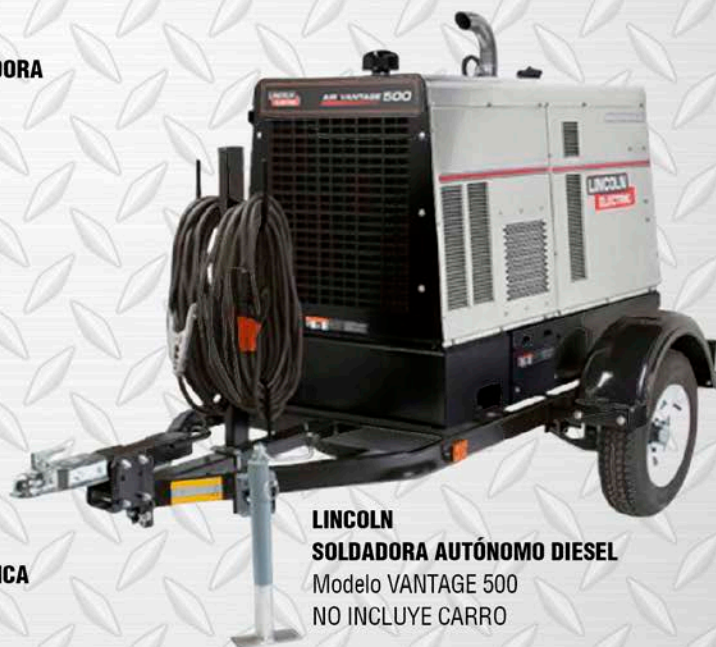
LINCOLN SOLDADORA AUTÓNOMO DIESEL Modelo VANTAGE 500 NO INCLUYE CARRO