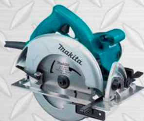
MAKITA CIERRA CIRCULAR 7.14 Modelo 5007 NK 1.800W