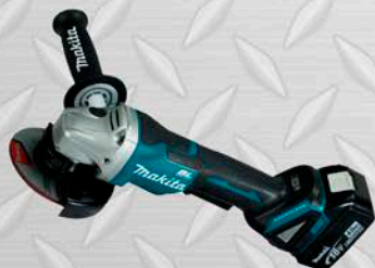
ESMERIL MAKITA Modelo DGA7000 7" Peso 2.3 Kg