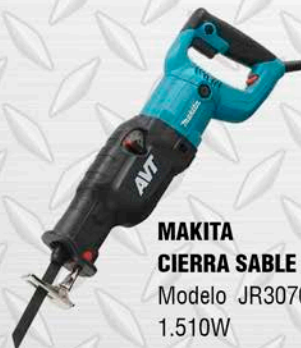
MAKITA CIERRA SABLE Modelo JR3070CT 1.510W