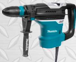
MAKITA ROTOMARTILLO Modelo HR4013 1100w BROCA 40mm.

ARRENDAMIENTO DE HERRAMIENTAS HIDRÁULICAS / NEUMÁTICAS / ELÉCTRICAS