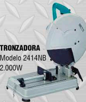
TRONZADORA Modelo 2414NB 2.000W