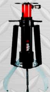
BVA EXTRACTOR DE GARRAS HIDRÁULICO