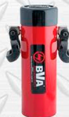
BVA ALTO TONELAJE