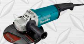
ESMERIL MAKITA Modelo GA9060 2200W