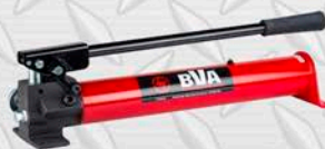
NOMBRE Y MARCA Modelo 2 LT