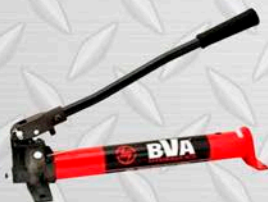
NOMBRE Y MARCA Modelo 1 LT