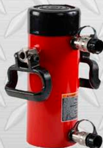
BVA DOBLE ACCIÓN