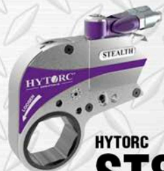
HYTORC ST8 2" - 3 7/8" 7980 LB/FT