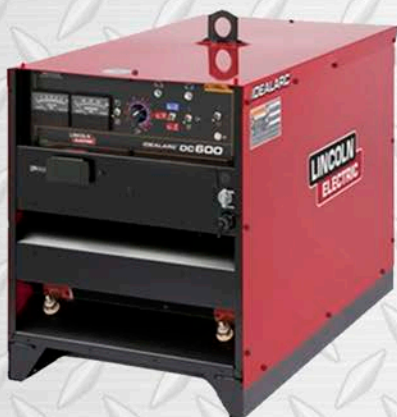
MÁQUINA SOLDADORA LINCOLN Dc600 230/460/3/60