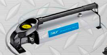
NOMBRE Y MARCA Modelo 21.000 PSI