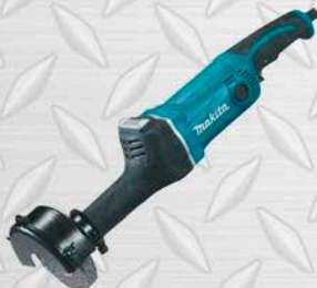
ESMERIL MAKITA RECTO 5 Modelo GS5000 750W