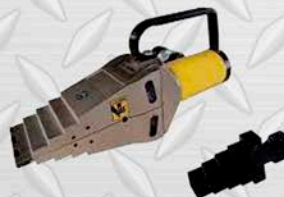
BVA SEPARADOR DE BRIDAS HIDRÁULICO