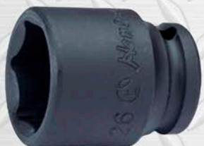
HANS CUADRANTE 1 1/2"