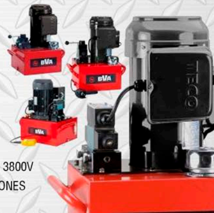
BVA BOMBA 3800V 40 GALONES