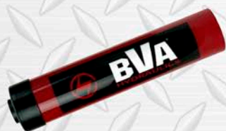
BVA SIMPLE ACCIÓN