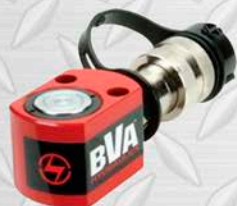
BVA 10.000 PSI 0.63" BAJO PERFIL

TODOS LOS MODELOS Y TONELAJES 5 - 100 TONELADAS