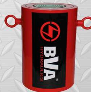
BVA ALTO TONELAJE