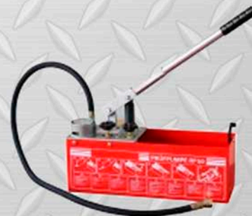
BOMBA PROBADORA REDES HONGLI Modelo RP-50