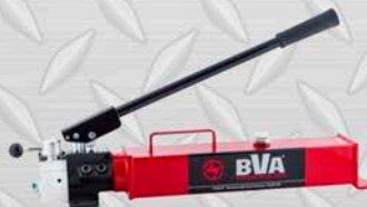
NOMBRE Y MARCA Modelo DA