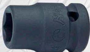
HANS CUADRANTE 3/4"