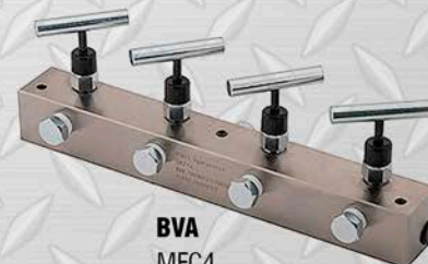
BVA MFC4 COLECTOR DE 5 PUERTOS CON 4 VÁLVULAS DE AGUJA