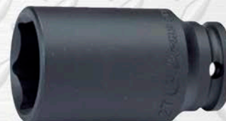
HANS CUADRANTE 1"