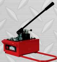
NOMBRE Y MARCA Modelo 2 GL