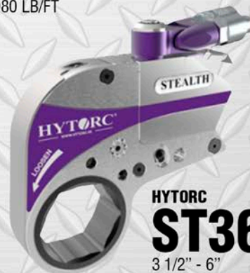
HYTORC ST36 3 1/2" - 6" 35120 LB/FT