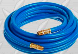
MANGUERA NEUMÁTICA 0000 x 20 MTS. 0000 x 20 MTS