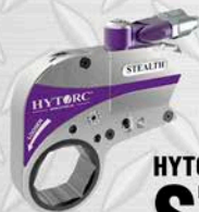
HYTORC ST2 1" - 2 3/8" 2000 LB/FT