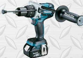
MAKITA TALADRO INALÁMBRICO CUAD. 12 Modelo DPH481 Incluye. CARGADOR Y BATERÍAS 18V