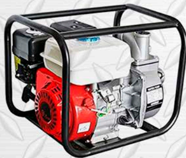
MOTOBOMBA TSURUMI 3 Modelo TE5-80H

ARRIENDO DE HERRAMIENTAS HIDRAULICAS / NEUMATICAS / ELECTRICAS