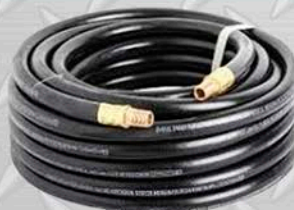
MANGUERA HIDRÁULICA CON CHICAGO SUPER SEGURO MANGUERA DE AIRE 1/2 x 20 MTS. 3/4 x 20 MTS.