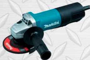
ESMERIL MAKITA Modelo 9557HPYG 800W. 4 1/2".