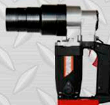
AST SW - 27 1 1/8"