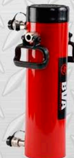
BVA 10.000 PSI 10" DOBLE ACCIÓN