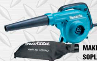
MAKITA SOPLADOR DE AIRE Modelo UB1103 600W