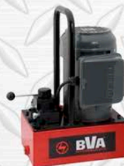
BVA S/A 10.000 PSI MANUAL