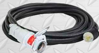
EXTENSIÓN ELÉCTRICA 220 V x 20 MTS. 380 V x 20 MTS