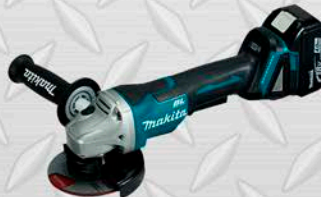
ESMERIL MAKITA Modelo DGA455 4 1/2" Peso 2.3 Kg