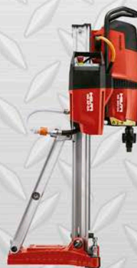
HILTI TESTIGUERA Modelo DD160 RANGO DE 25 A 202 mm. Incluye BOMBA DE AGUA