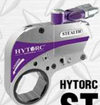
HYTORC ST4 1 1/2" - 3 3/8" 4000 LB/FT