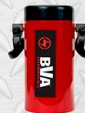
BVA H 10.000 PSI 10" PERFORADO