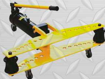
HONGLI CURVADORA HIDRÁULICA