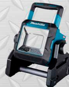
MAKITA FOCO LED INALÁMBRICO Modelo ML003G Incluye BATERÍA 18V