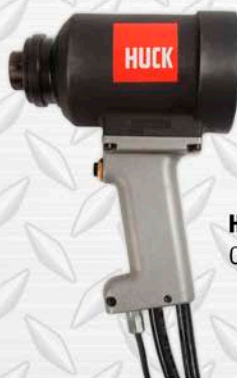
HUCK 2624 CORTA