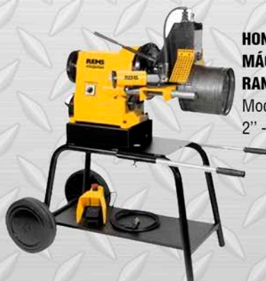
HONGLI MÁQUINA RANURADORA Modelo YG12A 2" - 12"