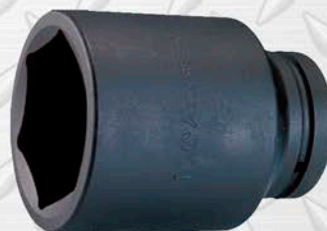
HANS CUADRANTE 2 1/2"