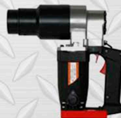
AST SW - 24 1"