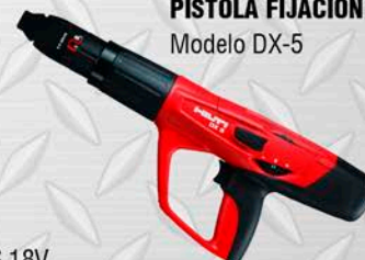
HILTI PISTOLA FIJACIÓN Modelo DX-5