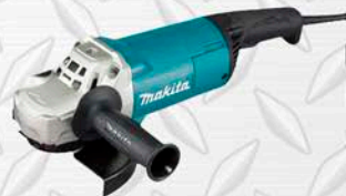
ESMERIL MAKITA Modelo GA7060 220V:22000W. 7".