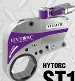
HYTORC ST14 2 3/4" - 4 1/2" 14200 LB/FT