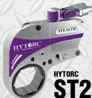
HYTORC ST22 2" - 15/169" - 6 1/8" 21800 LB/FT